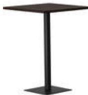
rq light t-2006