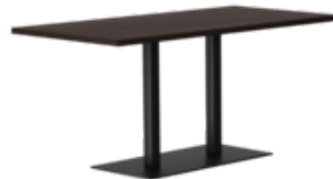
rq light t-2002