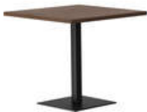
rq light t-2001