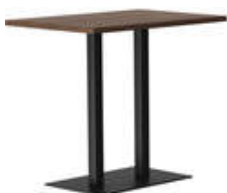
rq light t-2008