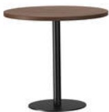
rq light t-2003