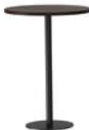
rq light t-2007