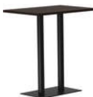
rq light t-2009